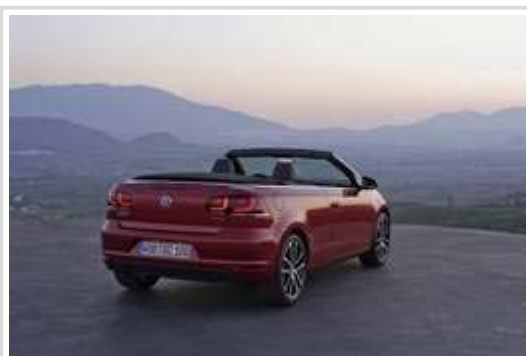
Golf VI Cabriolet: Bei geöffnetem Verdeck bietet der Kofferraum ein Volumen von 250 Litern, beide Rücksitzlehnen sind umklappbar.

Zu den Wettbewerbern des neuen Golf Cabrios werden auch Modelle aus dem VW-Konzern zählen. Die Marke Volkswagen etwa hat gerade erst das Klappdachauto Eos überarbeitet, und die zweite Auflage des Beetle Cabriolets steht für 2012 an. Überdies führt Audi mit dem A3 Cabrio einen offenen Kompaktwagen im Programm. Eine allzu gefährliche Kannibalisierung fürchtet VW dennoch