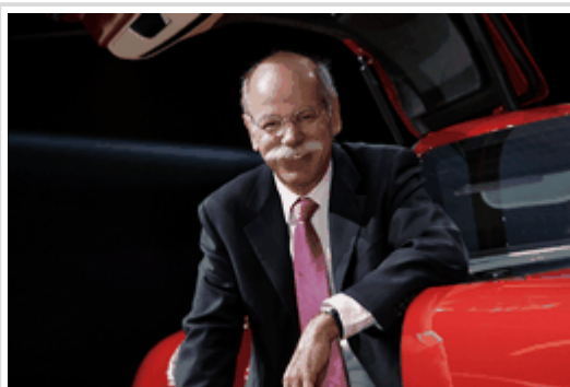
Dieter Zetsche: Der Daimler-Chef kündigt 10.000 neue Arbeitsplätze an.

In der Autosparte wollen die Stuttgarter trotz voll ausgelasteter Produktion an den Plänen festhalten, in einigen Bereichen Jobs abzubauen. Dafür wurden rund 100 Millionen Euro zur Seite