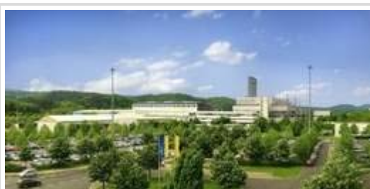
Opel in Eisenach:

Neben dem "Junior" arbeitet Opel auch mit Hochdruck an einem eigenen Nachfolger des Mikrovans Agila. Der 2007 erschienene Agila B basiert auf dem Suzuki Splash und wird im Suzuki-Werk im ungarischen Esztergom gefertigt. Wegen des VW-Einstiegs bei Suzuki (20 Prozent) wird das künftig nicht mehr möglich sein. Deshalb soll der Nachfolger des Agila nun auf einer global einsetzbaren GM-Plattform stehen, federführend ist dabei Chevrolet. Opels neuer Einstiegs-Mini soll zu Preisen ab 8000 Euro angeboten werden.