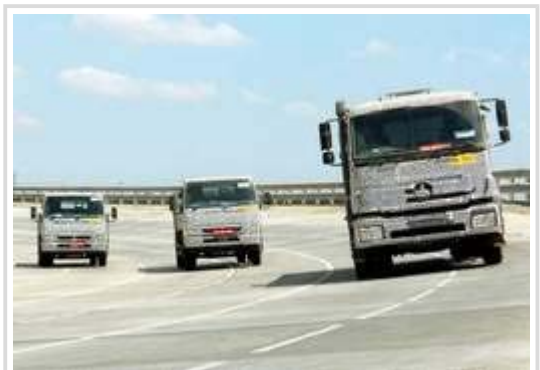
Prototyp eines BharatBenz Lkws: Mit der neuen Marke will Daimler den indischen Markt erobern.

Die Fahrzeuge sollen die Gewichtsklasse zwischen 6 bis 49 Tonnen abdecken und in Indien entwickelt und gebaut werden. Zum neuen Markennamen hieß es, "Bharat" bedeute in verschiedenen Landessprachen "Indien". Die Produktion in Oragadam bei Chennai soll 2012 anlaufen. Daimler investiert innerhalb von fünf Jahren insgesamt rund 700 Millionen Euro in den Standort.