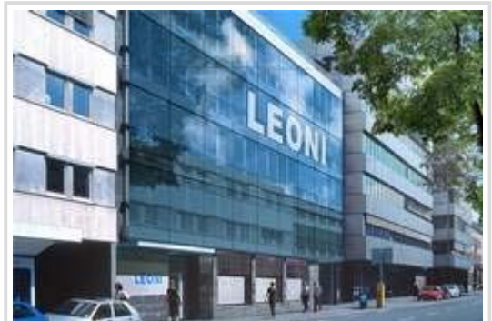
Leoni: Der Nürnberger Bordnetzspezialist steigerte seinen Umsatz 2010 nach massivem Stellenabbau auf den Rekordwert von 2,96 Milliarden Euro.

Den Unternehmen macht nicht mehr die fehlende Nachfrage zu schaffen. Im Gegenteil: vielerorts wird an der Kapazitätsgrenze gearbeitet. Sorgen bereiten den Managern vor allem die steigenden Rohstoffpreise. "Das sind große Unsicherheiten, die wir noch nicht abschätzen können", sagte ein Sprecher des bayerischen Sitzherstellers Grammer am Dienstag in oberpfälzischen Amberg.