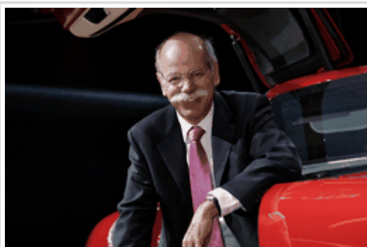
Daimler-Chef Dieter Zetsche: "Wir haben gezeigt, was in uns steckt - und wir bleiben auch 2011 auf dem Gas."

Stuttgart. Die Daimler AG hat im abgelaufenen Geschäftsjahr die eigenen Prognosen erfüllt und stellt für 2011 ein weiteres Gewinnwachstum in Aussicht. "Unser Ziel ist nun, das erreichte Ertragsniveau nachhaltig zu sichern und wo immer möglich weiter zu steigern", kündigte Daimler-Chef Dieter Zetsche bei Vorlage der vorläufigen Zahlen 2010 an. Konkret erwartet der Stuttgarter Autohersteller einen Gewinn vor Zinsen und Steuern (EBIT), der "deutlich über dem Niveau des Jahres 2010" liegt. Im vergangenen Geschäftsjahr stieg der Umsatz des Konzerns um 24 Prozent auf 97,8 Milliarden Euro. Nach einem operativen Verlust von 1,5 Milliarden Euro im Krisenjahr 2009 schrieb Daimler nun ein EBIT von knapp 7,3 Milliarden Euro. Netto wies das Unternehmen nun fast 4,7 Milliarden Euro aus, während 2009 ein Minus von 2,6 Milliarden Euro angefallen war.