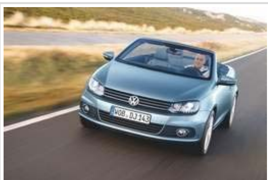
VW Eos: Das Cabrio trägt seit seinem Facelift Anfang des Jahres das neue VW-Gesicht.

Flensburg/Limburg. Ein Lüftchen um die Nase und das Lenkrad im Griff der Sonne entgegen - das offene Fahrgefühl wird beliebter in Deutschland. Jahr für Jahr werden hierzulande mehr und mehr Cabrios und Roadster gekauft - obwohl sie gegenüber geschlossenen Varianten teurer sind und weniger Platz bieten. Der Bestand offener Fahrzeuge ist laut Kraftfahrtbundesamt (KBA) in Flensburg 2010 um 4,5 Prozent gegenüber dem Vorjahr gestiegen und liegt nun bei 1,7 Millionen. Vor der kommenden Saison haben sich die Hersteller längst mit neuen Frischluft-Autos in Stellung gebracht. Auch das Comeback eines Klassikers steht an.