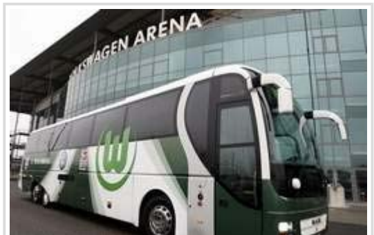
VfL-Wolfsburg: Angeblich sollen Telekom-Mitarbeiter versucht haben, durch die Verlängerung eines Sponsorvertrags an Aufträge von VW zu kommen.

Fahnder hätten Büros der Geschäftskundensparte T-Systems in Stuttgart durchsucht, sagte ein Telekom-Sprecher am Dienstag in Bonn und bestätigte einen Bericht der "Süddeutschen Zeitung". "Wir haben bereits personelle Konsequenzen gezogen." Ein T-Systems-Manager sei entlassen worden.