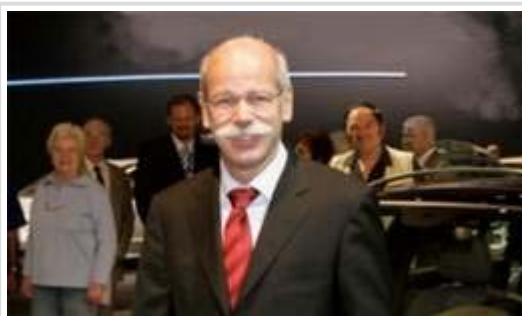
Daimler-Chef Dieter Zetsche: Der Manager kann strahlen. Rechtzeitig zum Jubiläumjahr brummt das Geschäft.

Stuttgart. Mit breiter Brust wird Daimler-Chef Dieter Zetsche am kommenden Mittwoch die Entwicklung des Autobauers präsentieren. Nachdem die Autoverkäufe in den vergangenen Monaten sprunghaft nach oben gingen, werden glänzende Zahlen beim Premiumhersteller für 2010 erwartet. Da das Management für das laufende Jahr bereits mit einem Pkw-Rekordabsatz rechnet, wird auch bei der Gewinnerwartung die Messlatte voraussichtlich deutlich angehoben. Für 2010 hat sich Zetsche vorgenommen, ein operatives Ergebnis von mindestens sieben Milliarden Euro zu präsentieren.