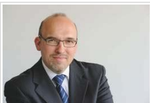
Vertriebsvorstand Christian Klingler: "Trotz der guten Zahlen agieren wir weiterhin mit Bedacht und beobachten die Entwicklungen auf den Weltmärkten genau."

Die tschechische Tochter Skoda wuchs in China sogar um 40 Prozent auf 20.400 Auslieferungen, Insgesamt lieferte sie 68.400 Autos aus, ein Plus von 26,4 Prozent. Die spanische Marke Seat - ein Sorgenkind des Konzerns - lieferte 25.700 aus und legte damit um 5,7 Prozent zu. Einen kräftigen Zuwachs von 57,9 Prozent verbuchten die leichten Nutzfahrzeuge mit 35.700 Auslieferungen. (dpa/swi)