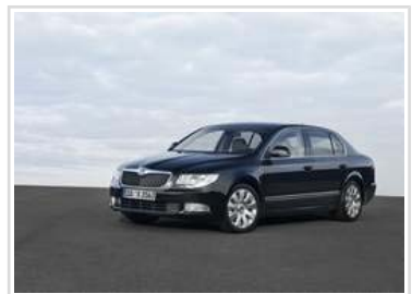
Skoda Superb: Das Topmodell legte im Januar um über 80 Prozent zu.

Mlada Boleslav / Weiterstadt. Starker Jahresauftakt für Skoda: mit 68.400 Einheiten legten die Verkäufe des tschechischen Herstellers im Januar 2011 gegenüber dem Vorjahr um 26,4 Prozent zu (Januar 2010: 54.100 verkaufte Einheiten). Damit bleibt die Marke auch im neuen Jahr auf klarem Wachstumskurs. Besonders gefragt waren zu Jahresbeginn die Modellreihen Fabia (plus 30,9 Prozent) und Superb (plus 80,3 Prozent). Hohe zweistellige Zuwächse erzielte das Unternehmen weiterhin in den Wachstumsregionen China, Indien und Russland.