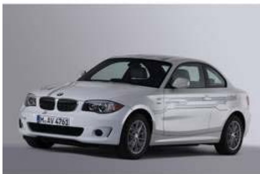
BMW ActiveE: In Genf wird BMW die endgültige Version der Elektro-Variante zeigen.

Der Elektro-1er trägt den Namen ActiveE. Er wird von einem 125 kW/170 PS starken Motor angetrieben, der seinen Strom aus klimatisierten Lithium-Ionen-Akkus bezieht. Anders als der Mini E, den BMW seit Mitte 2009 für Flottenversuche einsetzt, wird der 1er laut dem Hersteller ein absolut alltagstaugliches Auto sein: Alle Sitzplätze bleiben erhalten, das Kofferraumvolumen beträgt rund 200 Liter, hieß es. Im Mini E haben nur zwei Passagiere Platz, weil die Batterietechnik im Fond steckt.