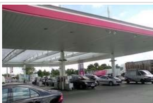
Bevorratung an Tankstelle: Sofern der Preis für Rohöl weiter steigt, werden sich auch Benzin und Diesel nochmals spürbar verteuern.

Die Unsicherheiten im weltweiten Rohölhandel werden auch in der deutschen Automobilindustrie wachsam registriert. Zum einen gelten deutsche Autofahrer im internationalen Vergleich als