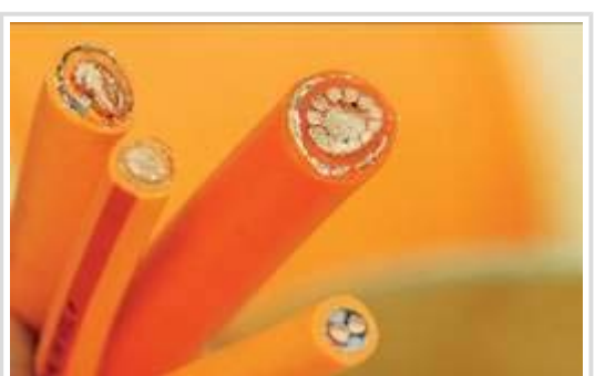
Spezialleitungen für Hochvolt-Bordnetze: "Es wird jetzt darauf ankommen, sich über die Aufgabenteilung zu unterhalten", sagte VDA-Präsident Matthias Wissmann im Interview mit Automobilwoche auf die Frage nach der Förderung von Elektromobilität.

Hamburg. Auf dem Montag (7. 2.) beginnenden EU-Verkehrsministerrat in der ungarischen Kapitale Budapest will sich Bundesverkehrsminister Peter Ramsauer (CSU) für eine Harmonisierung der Förderung von Elektroautos einsetzen. Als vorrangiges Ziel des Politikers gilt dabei, einen Subventionswettlauf in Europa zu verhindern. "Wir müssen verhindern, dass das Fördergefälle zu groß wird", sagte Ramsauer dem "Handelsblatt" (Montagsausgabe). "Ich stelle mir einen Korridor vor, innerhalb dessen jeder Staat den Kauf von Elektroautos fördern darf - ob nun mit einer Prämie oder mit steuerlichen und anderen Vorteilen. Darüber will ich mit den Autohersteller-Ländern eine Verständigung suchen."