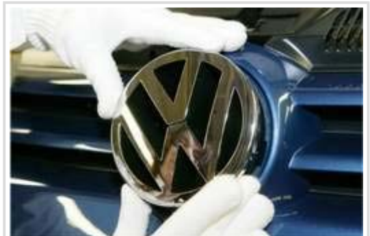
Handarbeit bei Volkswagen: "Auch wir müssen um jeden guten neuen Mitarbeiter kämpfen", verlangt Konzernchef Martin Winterkorn.

Nach einer Prognose des Personalressorts müssen zudem "allein in der Marke Volkswagen 60.000 Mitarbeiter ersetzt werden, die in den nächsten acht Jahren das Unternehmen verlassen werden". Überdies mahnen die Verfasser in ihrem Ausblick: "Gleichzeitig wächst die Komplexität. Die Zahl der Werke und der Anläufe nimmt weltweit zu, es wird immer wichtiger, die benötigten Qualifikationen zur rechten Zeit am richtigen Ort verfügbar zu haben".