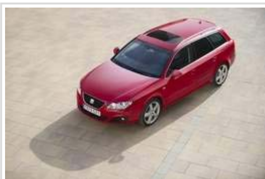
Seat Exeo: Das Mittelklasse-Modell gibt es jetzt auch als Diesel mit Automatik.

Zu Preisen ab 27.690 Euro für die Limousine und ab 28.590 Euro für den ST genannten Kombi gibt es einen 2,0 Liter großen Diesel mit der stufenlosen Automatik "Multitronic". Der Motor leistet 105 kW/143 PS. Er ermöglicht im Stufenheck 208 km/h Spitzentempo, im ST 201 km/h und steht mit einem Verbrauch von 5,8 Litern in der Liste (CO 2 -Ausstoß: 153 g/km). Auch äußerlich gibt es eine kleine Änderung: Zum neuen Modelljahr bekommt der Exeo Bremsleuchten mit LED-Technik. (dpa/swi)